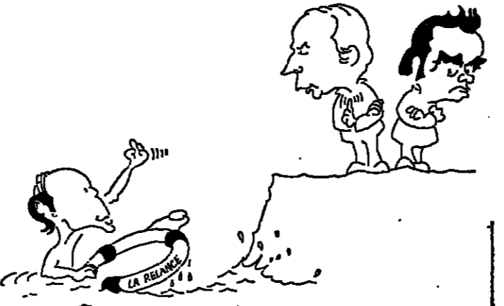
(Dessin de CHENEZ)

« Mon cher premier ministre, le gouvernement prépare, sous votre direction, un ensemble de mesures de caractère économique, qui sera définitivement arrêté le 4 septembre prochain... »